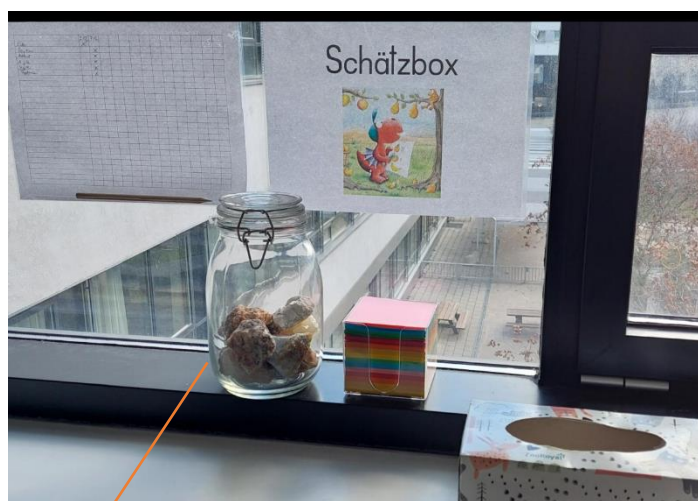
Wie viele Steine sind im Glas? Schätze!